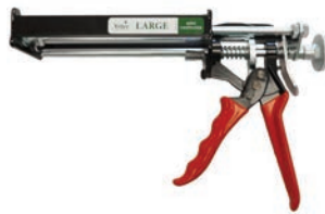
BOVI-BOND APPLICATOR GUN PISTOLET APPLICATEUR BOVI-BOND $119.95