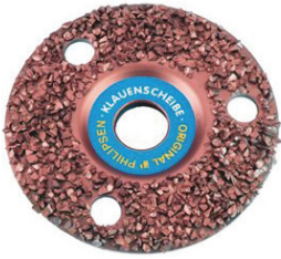
HOOF DISC - PHILLIPSEN DENSE 4.5" DISQUE SABOT PHILIPSEN DENSE 115MM $69.99