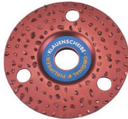
PHILIPSEN HOOF DISC 115MM The original abrasive disc and the professionals disc of choice. DISQUE SABOT PHILIPSEN 115MM ESPACÉ Le disque abrasif d'original et le disque professionnel de choix. $69.99