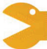
HOOF MEASURING DEVICE YELLOW TESTEUR D'ONGLONS JAUNE $9.95