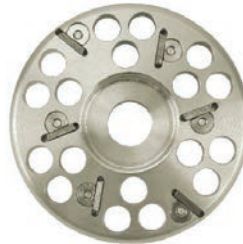
HOOF DISC - 3 KNIFE For professional hoof care we offer an innovative tool: The disc with 3 or 6 cutters! The geometric arrangement of the knives has been optimised and can now guarantee a better grinding performance for max. 700 animals per set of knives. DISQUE SABOT 3 COUTEAUX