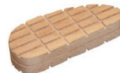
WOODEN HOOF BLOCK

Wooden block is designed for the reconstruction of the shoe with glue Bovi-bond.