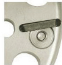
SPARE KNIVES FOR HOOF DISC (3) Blade assembly for aluminum hoof disks. ENSEMBLE DE LAME DISQUE SABOT (3) Assemblage de lame pour les disques à sabots en aluminium. $79.95