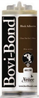
BOVI-BOND ADHESIVE 180 CC Bovi-bond adhesive tube is the reconstruction of bovine hooves. Use with wood block and freezes in 30 seconds. TUBE ADHESIF BOVI-BOND 180CC L'adhésif en tube Bovi-Bond sert à la reconstruction des sabots bovins. Utiliser avec un bloc de bois, il fige en 30 secondes. $54.99