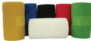
VET WRAP - 2" SHARPFLEX This versatile bandage is available in black, white, red, blue and assorted. BANDAGE 2" SHARPFLEX Ce bandage polyvalent est disponible en noir, blanc, rouge, bleu et assorti. $1.25